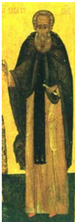
память преподобному Савве Вишерскому 14 октября

В Покровском соборе Великого Новгорода находятся мощи преподобного святого Саввы Вишерского , жившего в 15 веке. Он подвизался недалеко от Новгорода, на реке Вишере. Там он построил церковь в честь Вознесения Господня. Вскоре на этом месте был основан монастырь.